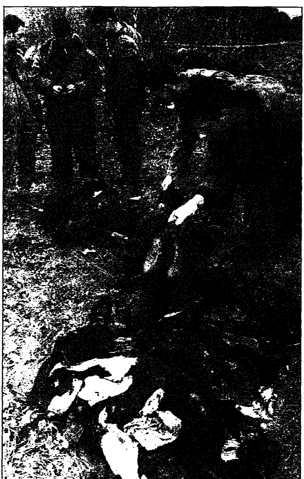
جند اسراييليون يجمعون اشلاء القتلى